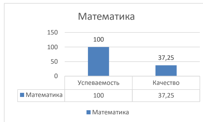
Таблица 2 Результаты ОГЭ по математике в 2022 учебном году