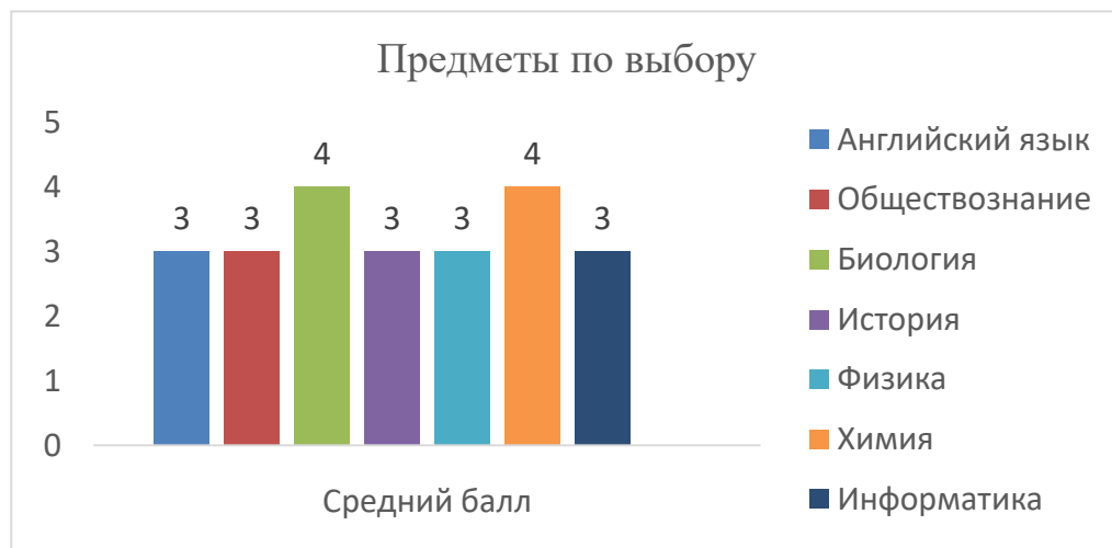
Таблица 3 Средний балл ОГЭ по предметам на выбор в 2022 учебном году